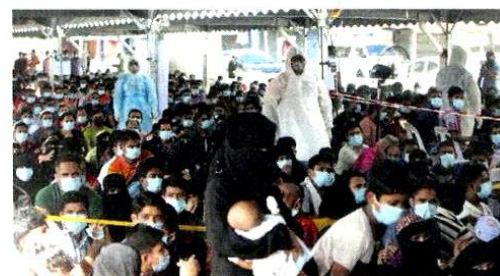
ANTARA warga asing yang perlu menjalani ujian saringan Covid-19 di Klang, semalam.

2,018 individu dikesan positif Covid-19 semalam