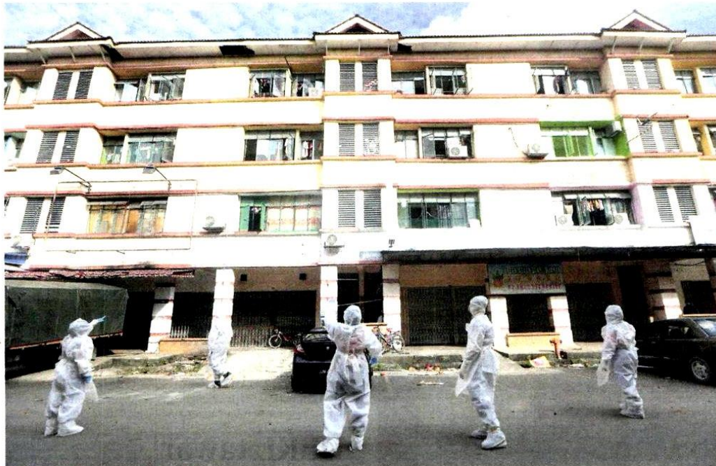
ANGKATAN Pertahanan Awam Malaysia (APM) memakai pakaian kelengkapan perlindungan diri melakukan pemeriksaan dari rumah ke rumah ke atas warga asing bagi membuat ujian saringan Covid-19 di Kompleks Pasar Meru, Klang, semalam.

Oleh Nurul Hidayah Bahaudin am@hmetro.com.my