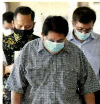
Tengku Adnan kelihatan sugul ketika keluar dari Mahkamah Tinggi Kuala Lumpur pada Isnin.