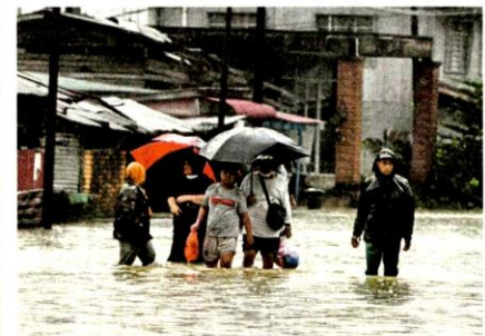
Penduduk terpaksa meredah banjir berikutan limpahan air Sungai Golok di sekitar Rantau Panjang.

Bagaimanapun, Jabatan Pengairan dan Saliran (JPS) melalui portal http://infobanjir.water.gov.my melaporkan Sungai Pahang di Lubuk Paku, Maran berada di paras waspada, manakala Sungai Yap, di Jerantut dan Sungai Lepar, di sini di paras amaran.