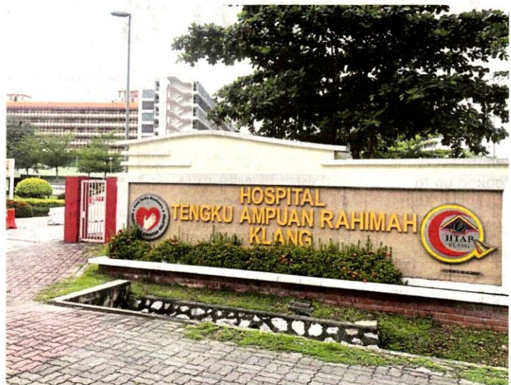
A total of 143 Covid-19 cases have been recorded at Tengku Ampuan Rahimah Hospital in Klang.

"I will also propose some new strategies to contain the spread of the virus at the meeting with the