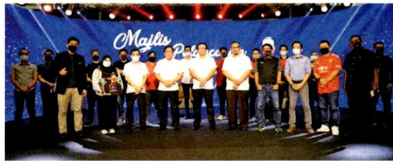
Tabung Endowmen Majlis Daerah Hulu Selangor merupakan yang pertama kali diwujudkan PBT negara ini.

dowmen sangat popular di luar negara sebagai sebuah tabung kebajikan bagi mengumpul dana melalui sumbangan sukarela yang mana hasil atau pulangan yang dijana memberi manfaat kepada masyarakat sama seperti wakaf.