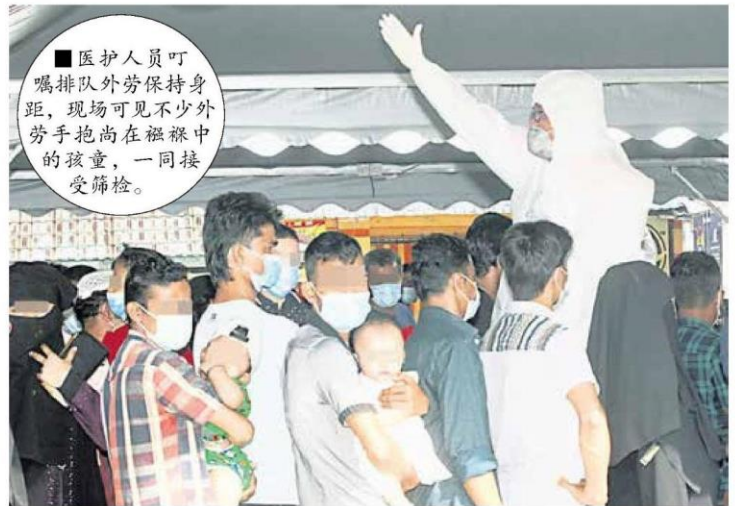
■医护人员叮嘱排队外劳保持身距，现场可见不少外劳手抱尚在襁褓中的孩童，一同接受筛检。