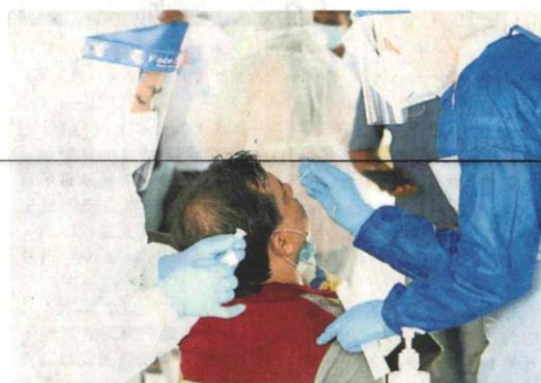
当局采用快速检测，短短 25 分钟就可取得结果。

因此，媒体代表在离开时，纷纷被要求出示检测报告，否则皆不得离开，这一度让媒体代表们进退两难，最终只好遵守当局的指示，检测及等报告出炉才离开现场。