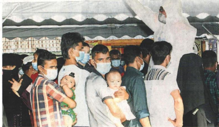
一些在我国落地生根的外籍劳工，经医务人员指示遵守标准作业程序，携家带眷耐心排队等候检测。

医务人员也不断通过扩音器宣传，呼吁租屋区居民检测，同时指示大家遵守标准作业程序。不过，一些住在南德园的难民及外籍劳工，则不知是抱持观望态度或因检测区已满人，只是站在外围观望等候。