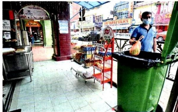
Shopowners are supportive of MPK's Cleaner Little India campaign.