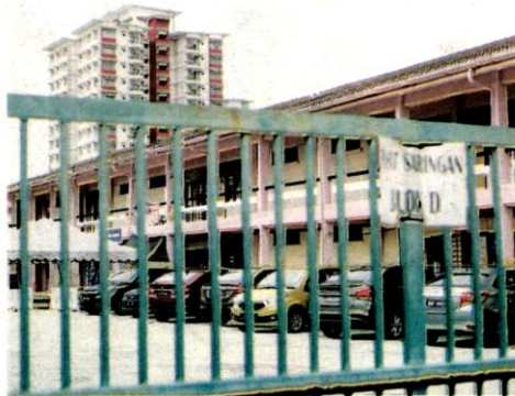
SERAMAI 62 kakitangan dan 81 pesakit HTAR, Klang disahkan positif Covid-19 sehingga kelmarin. - ZULFADHLI ZAKI