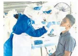
■雪州Selcare医护人员为巴生中路大巴刹外劳，进行冠病快速检测。

大巴刹是在本月7日传出确诊，一名鱼贩被指高烧不退，随著身边亲友确诊后，才去进行检测，结果证实染疫。(TKM)