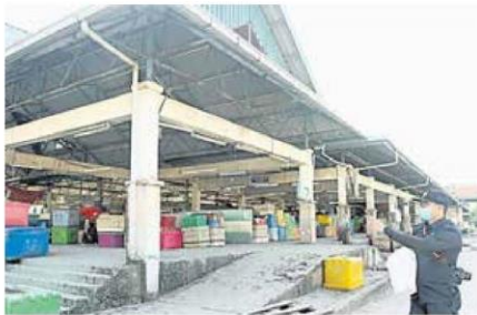
■中路大巴刹连续两天停业进行消毒，执法人员也到场监督情况。