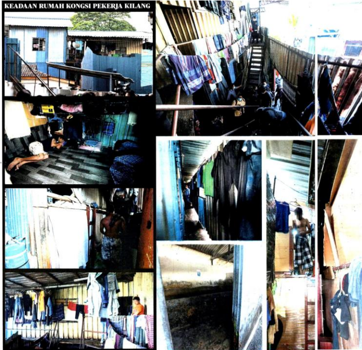
KEADAAN RUMAH KONGSI PEKERJA KILANG