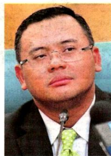
Datuk Seri Amirudin Shari

placed under an Enhanced Movement Control Order following the rise in number of cases, including in HTAR, Amirudin said the decision would be up to the National Security Council (NSC).